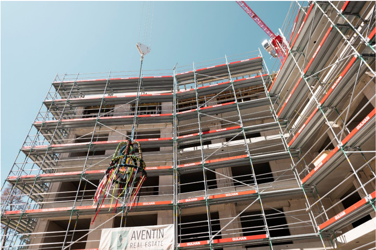
Neubauprojekt Paul-Gossen-Straße 117a in Erlangen

Die Aventin Real Estate Gruppe feiert das Erreichen weiterer wichtiger Meilensteine bei ihrem Bauprojekt „Weitblick Erlangen“.